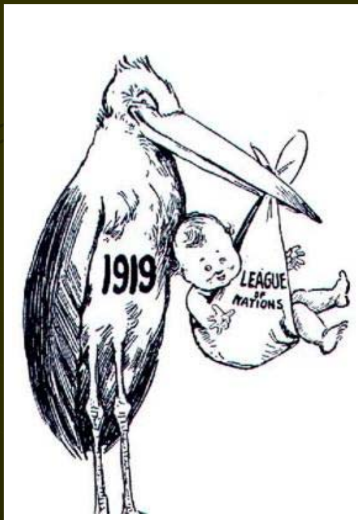
Карикатура на Лигу Наций

Англия хотела сохранить Германию как противовес Франции, а Вильсон требовал выполнения выдвинутых им принципов.