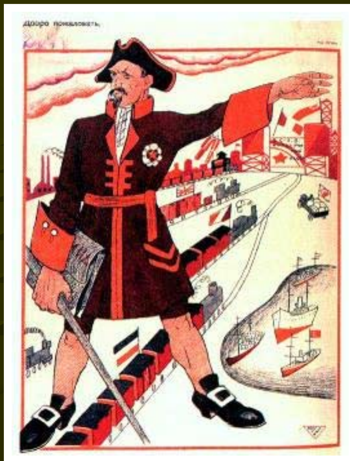
Г. Чичерин в образе Петра I. Плакат 1923г.

Вне Версальской системы осталась Россия. Запад, заинтересованный в торговле с ней, пригласил советскую делегацию на конференцию в Геную .