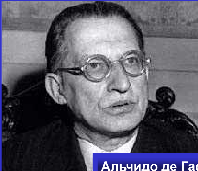
Альчидо де Гаспери