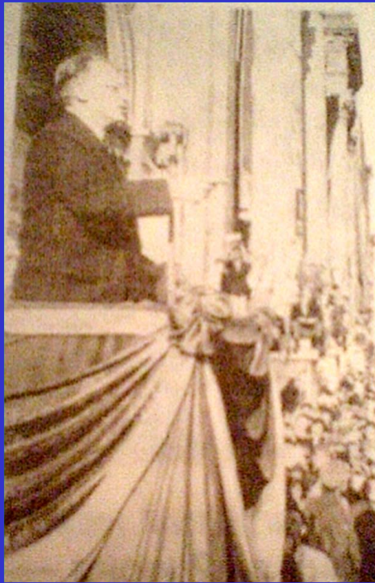
Премьер-министр Италии А. де Гаспери выступает на митинге в Милане (апрель 1948 г.)

В 1947 г. была принята конституция. Главой государства по конституции является президент, избираемый двумя палатами парламента (палата депутатов и сенат). Обе палаты избираются по пропорциональной системе представительства всеми гражданами. Провозглашалось, что частная собственность неприкосновенна, но может быть ограничена по закону на основе её компенсации. Конституция провозглашала основные права граждан, равные для мужчин и женщин, чего в Италии раньше не было. Конституция провозглашала и право на труд.