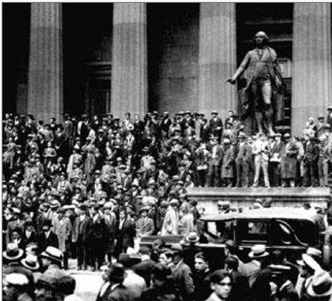
Перед зданием Нью-Йоркской фондовой биржи в "черный вторник" 29 октября 1929 года