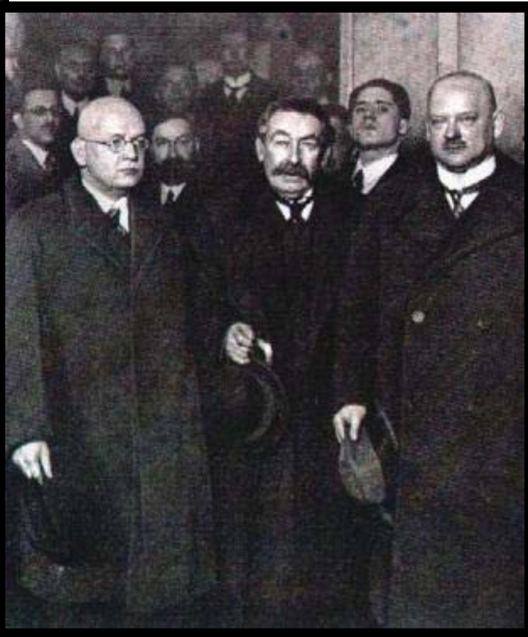
Аристид Бриан. (в центре).

Появилось огромное количество теорий о том как преодолеть кризис. Социалисты предлагали ликвидировать капитализм, националисты-установить господство над другими народами.