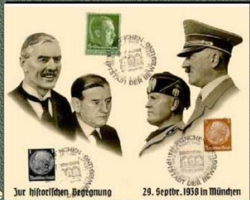
Zur historischen Begegnung