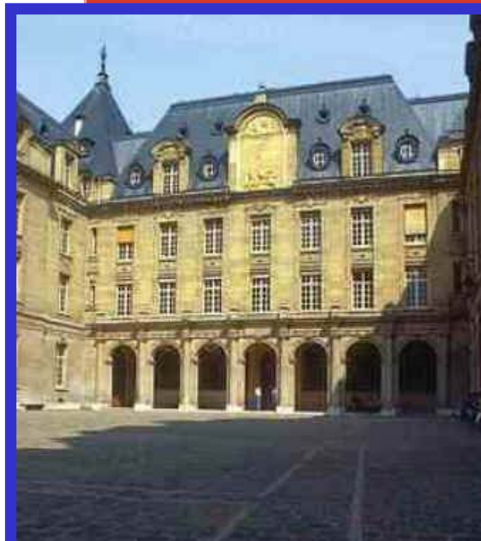
Сорбонский университет. Париж.

Но постепенно в стране начало нарастать недовольство авторитарным стилем руководства, характерным для Ш. Де Голля.