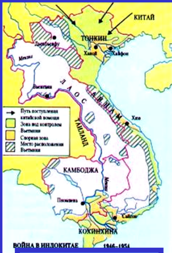
Война в Индокитае