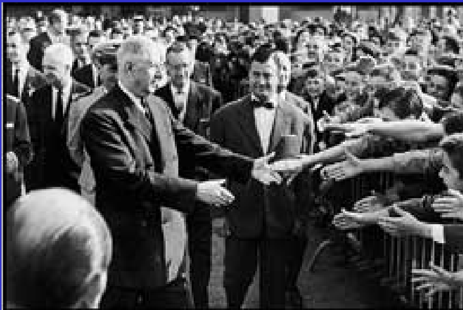
Французы приветствуют Шарля де Голля

В послевоенной Франции расстановку политических сил определяли Французская Коммунистическая партия (ФКП), Социалистическая партия (СФИО), Католическая партия и Народно-республиканское движение (МРП). В октябре 1945 г. состоялись выборы в Учредительное собрание, победу на которых одержали левые силы, которые активно участвовали в Движении Сопротивления. Во главе сформировавшегося правительства стал Шарль де Голль. В 1946 г. была принята новая Конституция, которая знаменовала собой установление во Франции Четвёртой республики.