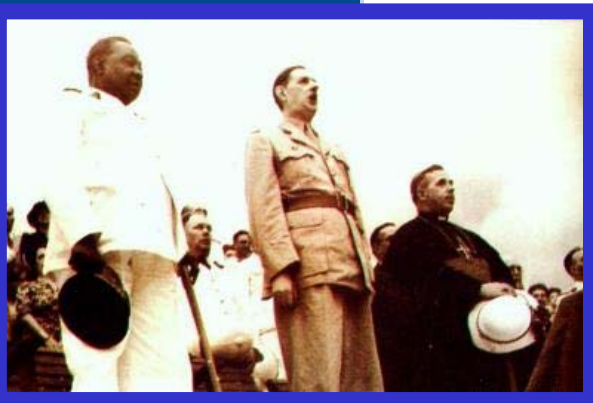
Генерал де Голль

Основные силы страны видели в Шарле де Голле сильную личность. В 1958 г. де Голль стал премьером и провел через референдум Конституцию, превращавшую Францию в президентскую республику. Последующий период вошёл в историю Франции под названием Пятой республики.