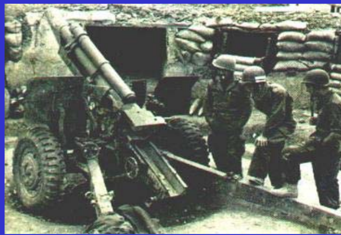
Французские солдаты в Индокитае

Согласно конституции французская колониальная империя преобразовалась во Французский Союз, в который включались и государства, вставшие уже на путь независимости. Среди них были Вьетнам, Камбоджа, Лаос. Но коммунистическое правительство Вьетнама отказалось признать это решение, что привело к войне Франции против Демократической Республики Вьетнам (1946-1954 гг.).