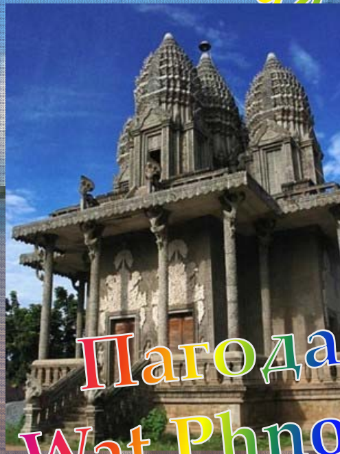
Пагода Wat Phnom