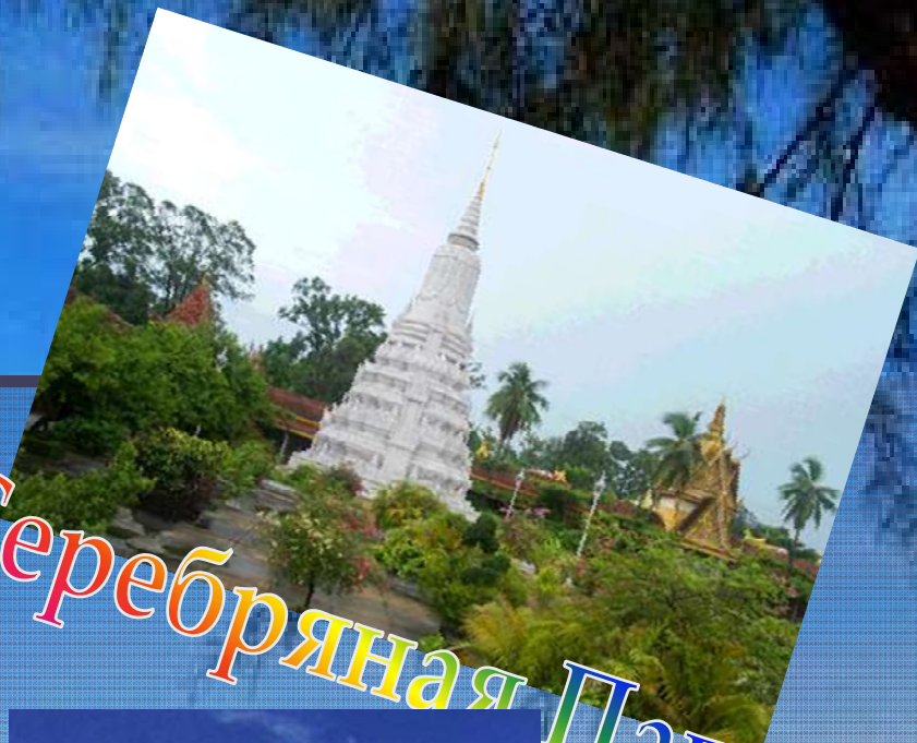
Королевский дворец Серебряная Пагода