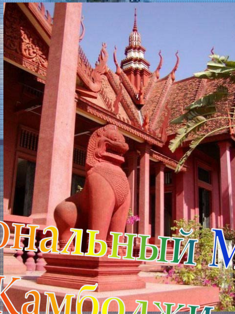
Национальный Музей Камбоджи