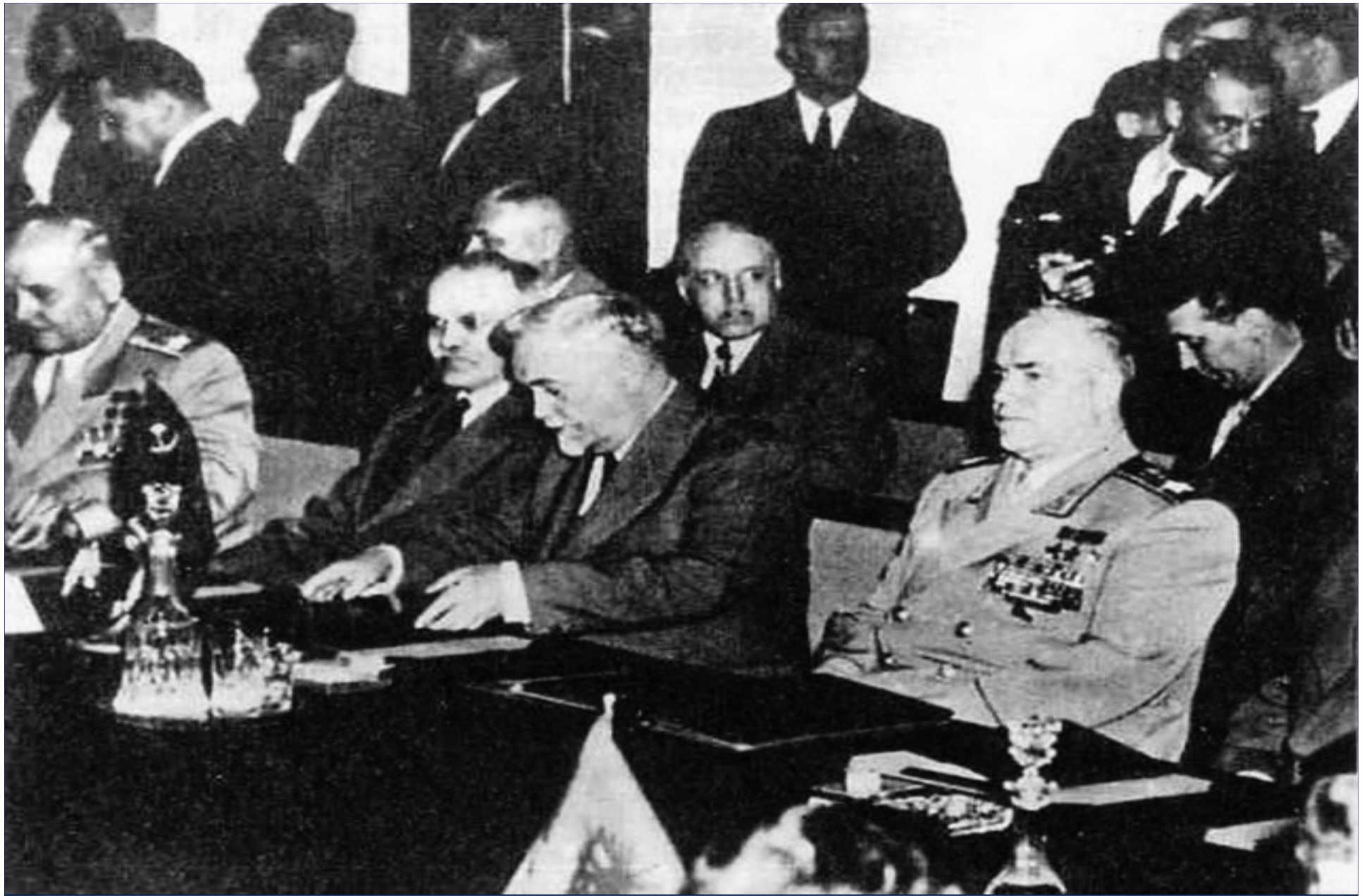
Подписание договора об образовании ОВД. 1955 г.