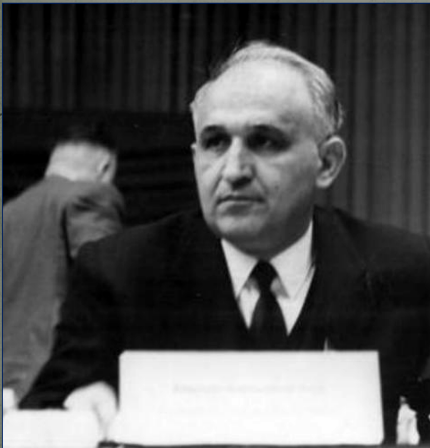
«Отец всех болгар» Тодор Живков. Правитель Болгарии с 1954 по 1989 гг.

«Реальный социализм» оказался тупиковой ветвью развития. К концу 80-х гг. в связи с перестройкой в СССР в странах Восточной Европы проходят «бархатные революции» свергающие коммунистические правительства.