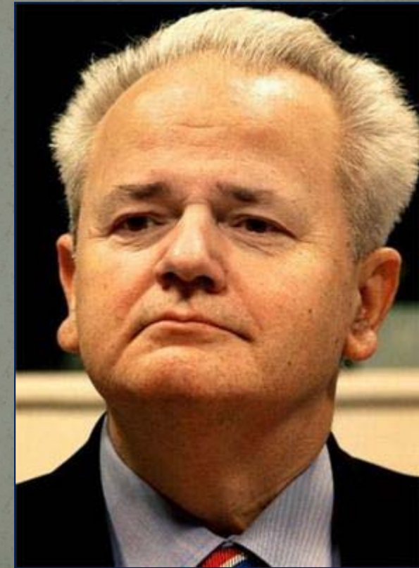
Президент Югославии (Сербии) С.Милошевич.