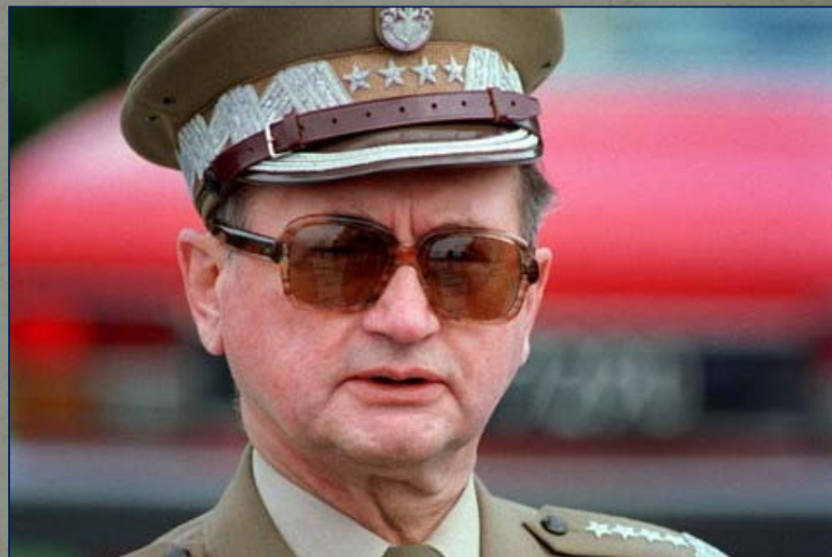
Генерал Войцех Ярузельский, введший в Польше ЧП и правившей ею с 1981 по 1990 г.