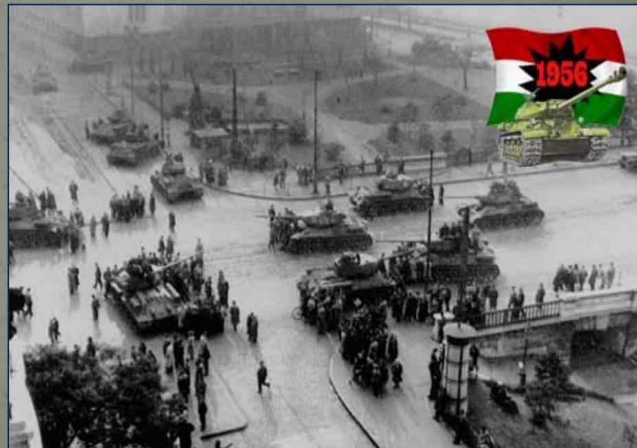
Венгрия. 1956 г.