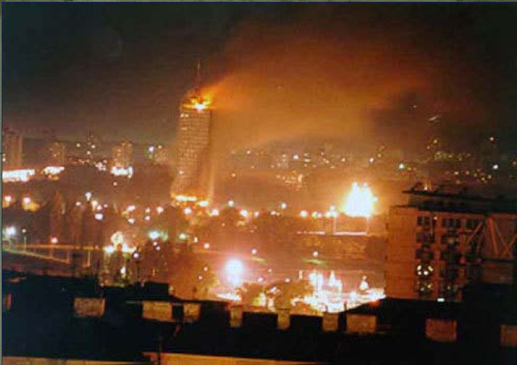
Воздушный удар авиации НАТО по Белграду, столице Югославии. 1998 г.