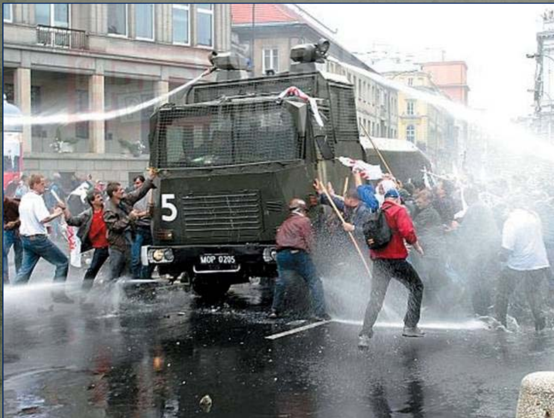
Польша. 1990 г.

Летом 1989 г. началась революция в ГДР, закончившаяся падением Берлинской стены. Реформы начались в Польше, Венгрии, Болгарии, Албании, Чехословакии. Электрик Л.Валенса, лидер профсоюза «Солидарность» становится президентом Польши в 1990 г.