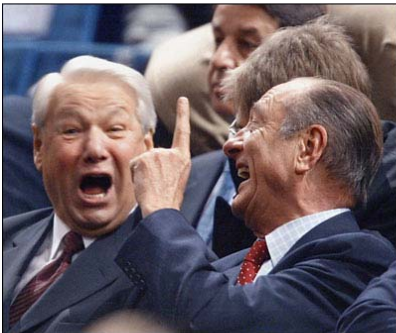
Б.Ельцин и Жак Ширак

В 1993 г. в России была принята Новая Конституция, которая дала большие полномочия президенту. Парламент стал двухпалатным: Совет Федерации (верхняя палата) и Государственная дума (нижняя палата).