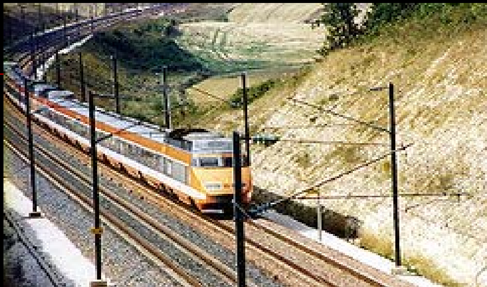
Поезд TGV PSE на линии Париж—Лион