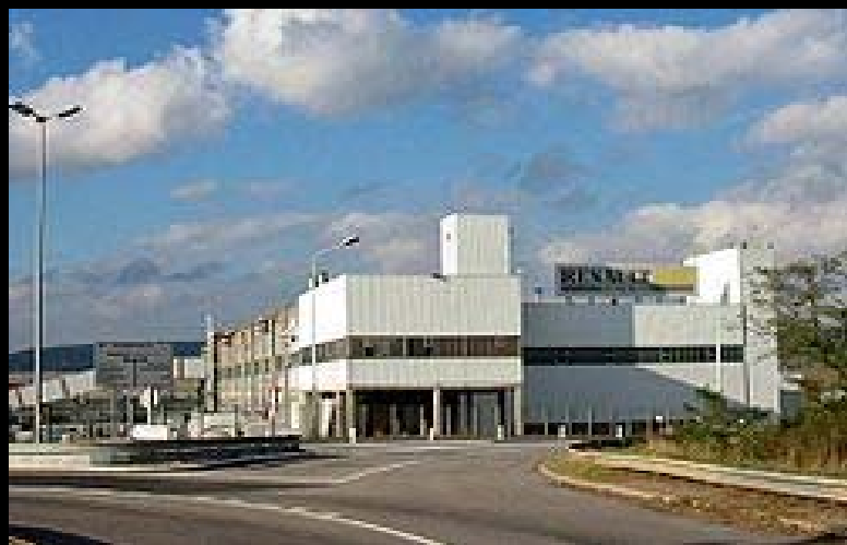
Завод «Renault» в городке Обергенвилль