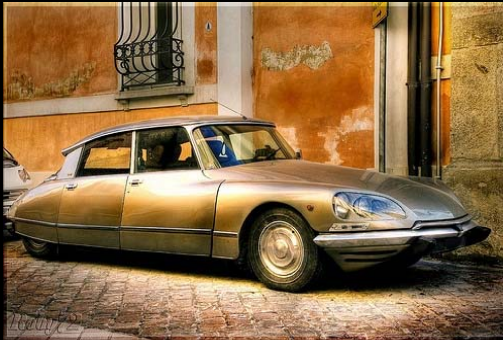
Автомобиль завода «Рено»